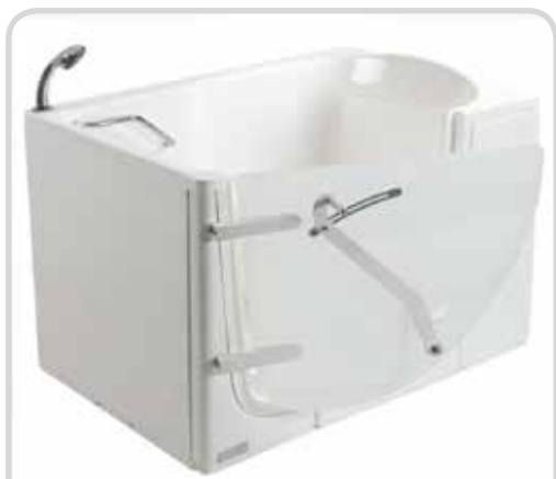
Vasche e box doccia accessibili